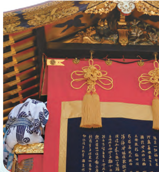
見送「金剛界礼懺文」と左右一対

重量／11.39トン 高さ／地上から鉾頭まで約24m 車輪／直径約2m前後 鉾屋根／長さ約3.5m・巾約4.5m 鉾床面積／4畳半～6畳