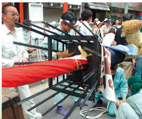
関と石垣模様の布の取り付け