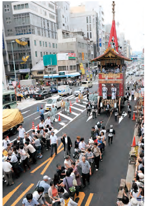
「曳き初め」は人気行事の一つ