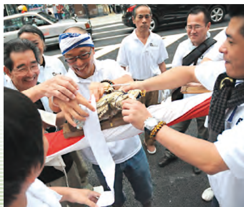
天人形の取り付け