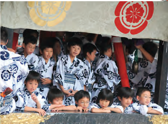
鉦の曳き初めに参加する子供達